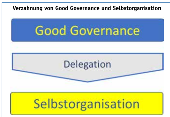
Abb. 1: Verzahnung von Good Governance und Selbstorganisation. Die Verzahnung ist in der Initiative Strategiewechsel jetzt! (6) durch eine klare Regel (S3) realisiert. Das Delegationsverfahren wird vom Bundestag beschlossen und vom BMG operationalisiert.

Die laufende Gesundheitsberichtserstattung nach den Grundsätzen eines Public Reporting zeigt Bürgern und Patienten auf den verschiedenen Ebenen wie gut die subsidiären Ziele erreicht werden. Qualitätsorientierte Vergütung bzw. Ressourcenzumessung entfalten über die Methoden der allokativen Effizienz eine steuernde Wirkung. Dabei ist die Versorgungsforschung aufgerufen, geeignete Methoden zu entwickeln, um den Einfluss systemischer Vorgaben auf die operative Gesundheitsversorgung besser zu verstehen und transparenter zu machen.